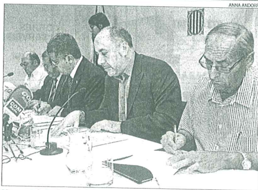
Moment de la firma del conveni amb els regants de l'Urgell.

10%), Llana va assegurar que no afectaran el Segarra-Garrigues, ja que té una pla financer tancat i en execució. De tota manera, va reconèixer que algunes de les obres que la conselleria executa a Lleida registraran alguns retards a causa del pla d'austeritat. "Desplaçarem les inversions fins a l'any que ve per ajornar els pagaments", va assenyalar.